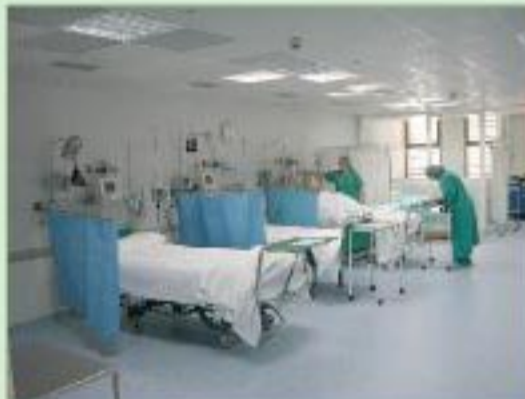
La nueva sala de reanimación- cuidados críticos