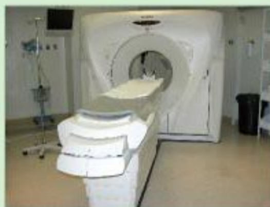
Un TAC Helicoidal de última generación para los usuarios del hospital de Cieza