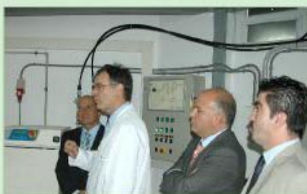
El director médico de Hoces explica el funcionamiento de parte de la magnetorresonancia instalada