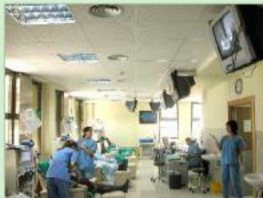
Los pacientes que precisan hemodiálisis no tienen que desplazarse como venían haciendo