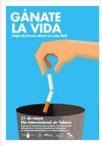
Cartel “Gánate la vida”

Materiales que reflejan las ventajas de dejar de fumar y los beneficios del abandono de tabaco, junto con consejos para dejar de fumar.