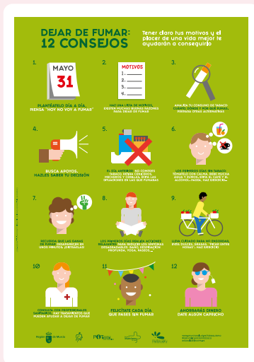
Cartel “12 Consejos para dejar de fumar”