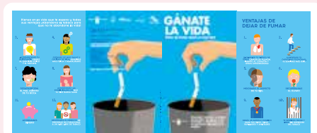
Folleto “Gánate la vida. Dejar de fumar ahora es más fácil”