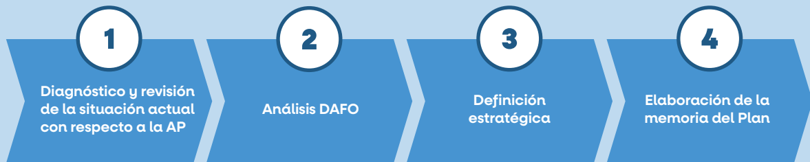
Ilustración 10. Fases del diseño de la EMAP en la Región de Murcia

El diseño de la Estrategia se ha llevado a cabo en cinco fases.