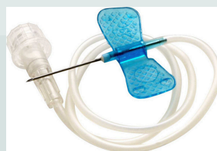
Aguja de acero inoxidable

Cambio de sistema: Tiempos variables según protocolo y /o necesidades del paciente