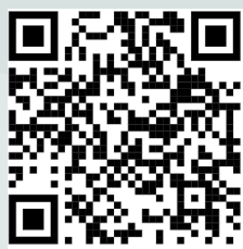
Video colocación Neria Guard