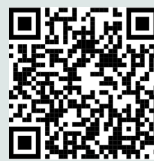
Video de administración de mediación