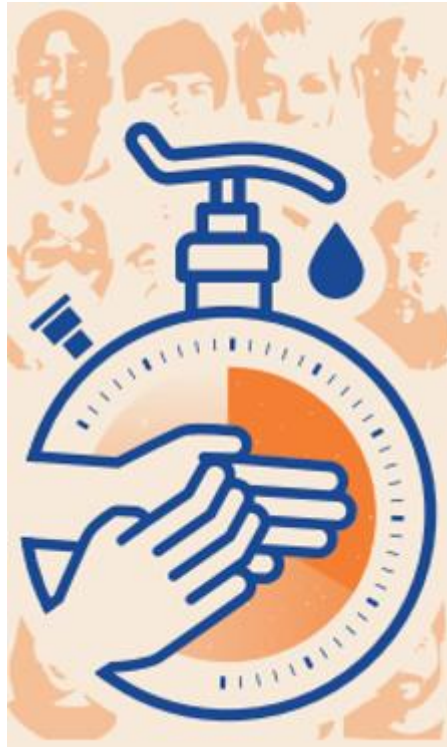
IMAGEN DE ACCESO AL ROSCO DE PREGUNTAS DE HIGIENE DE MANOS