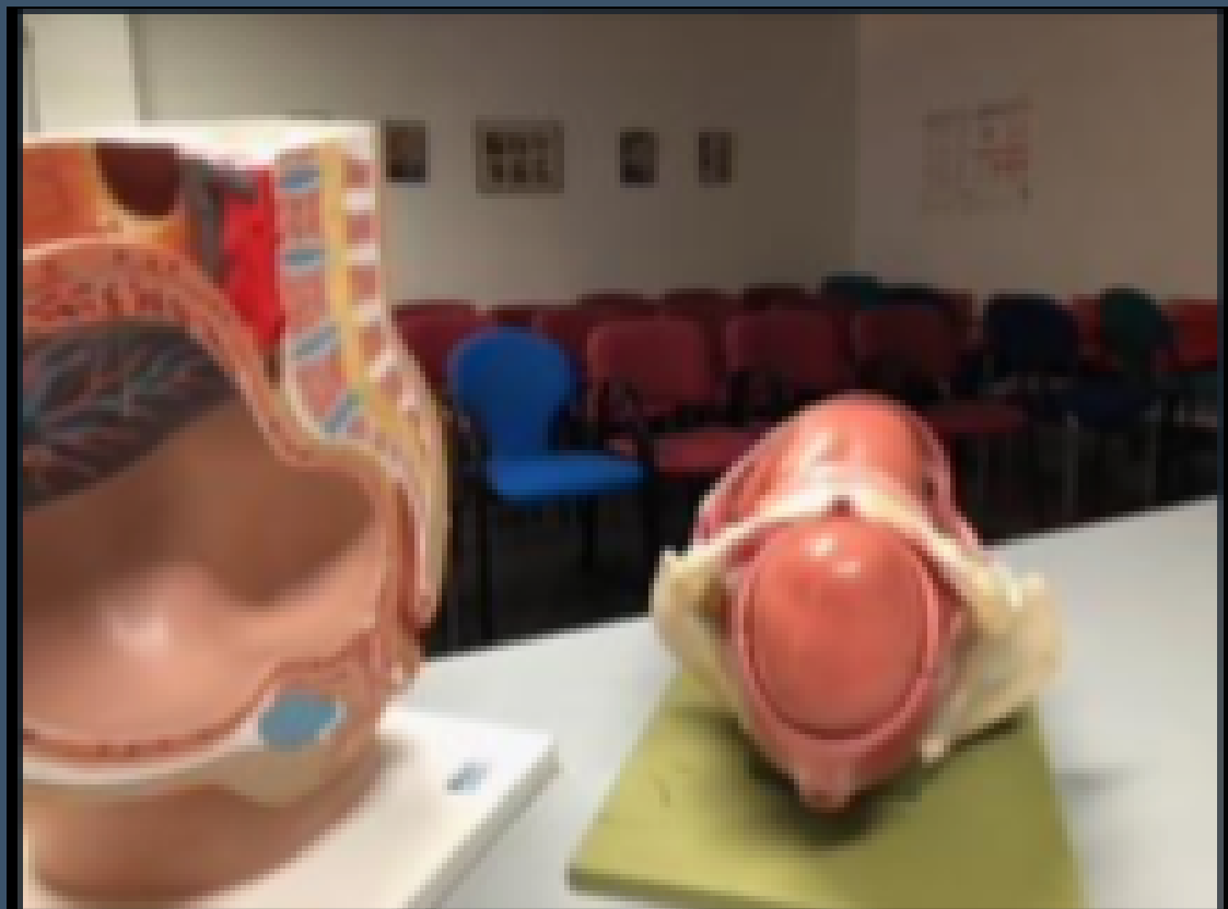
SALA DE EDUCACIÓN MATERNAL