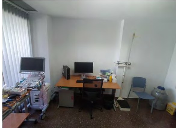
Figura 7. Sala de crioterapia, infiltraciones, cirugía menor.