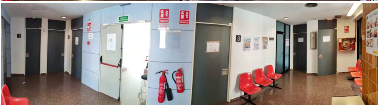
Figura 8. Vista panorámica de la tercera planta.