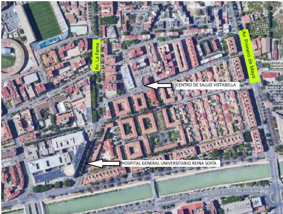
Figura 2. Vista referencial del centro de salud.

El centro de salud está compuesto por 3 plantas y planta baja, y su entrada principal es a través de la calle Thader, una ramificación de la calle Párroco Pedro Martínez Conesa, que une las avenidas de la Fama con la Avenida Primero de Mayo (Figura 2).