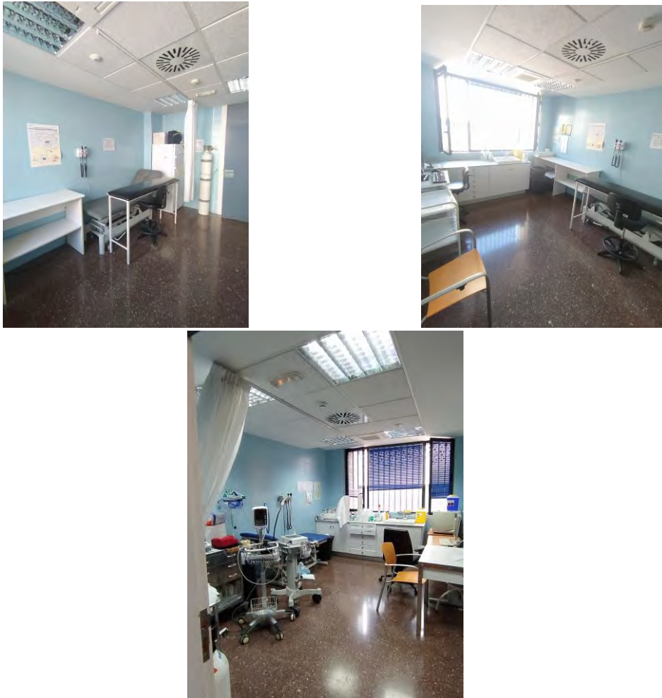
Figura 3. Sala de extracciones y urgencias.