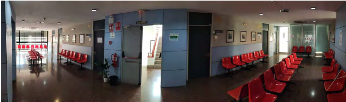
Figura 5. Vista panorámica de primera planta.