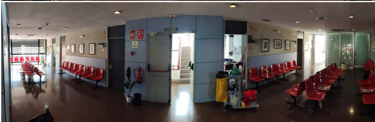
Figura 6. Vista panorámica de segunda planta.