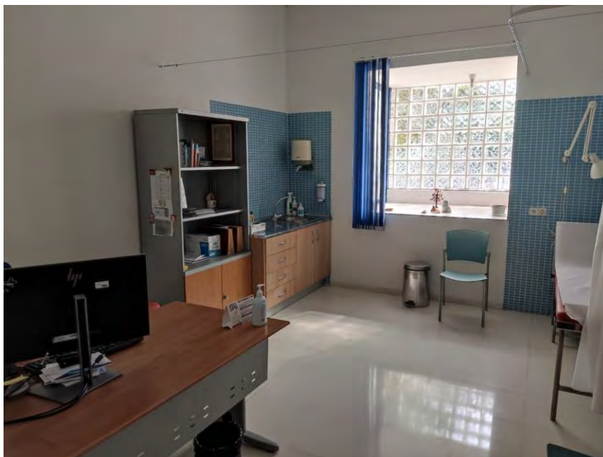
Fotografía 11: Consulta de Medicina Familiar y Comunitaria.

Los médicos de familia suelen atender una media de unos 40 pacientes por día. Bien es cierto que, durante las vacaciones de algún compañero, si no hay sustituto otro médico atiende a sus propios pacientes y a los de su compañero, llegando incluso a ver a más de 80 pacientes por día, lo que hace complicado llegar a una buena calidad asistencial. Cabe destacar que además de asistir a los pacientes en sus patologías, el médico de familia realiza una labor de prevención, aconsejando a los pacientes como vivir de una manera más saludable.