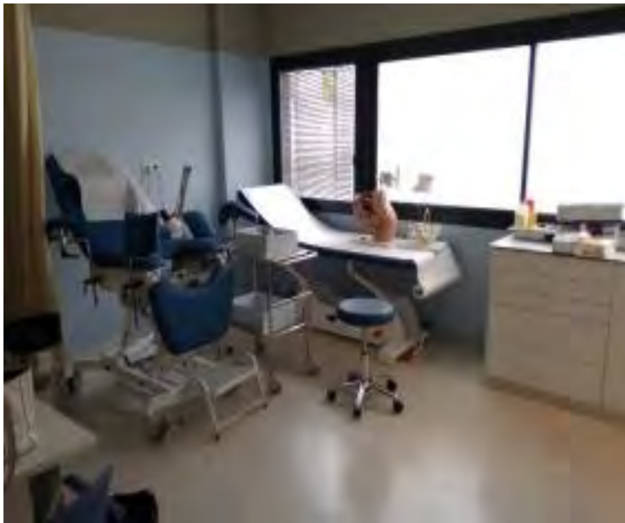
Fotografía 5: Despacho e instalaciones de nuestra matrona.

su taller para la educación maternal en las que se trata tanto de preparar a la gestante para el parto, como educación general sobre qué esperar durante el embarazo y cómo actuar ante determinadas situaciones para vivir esta etapa lo más cómodamente posible.