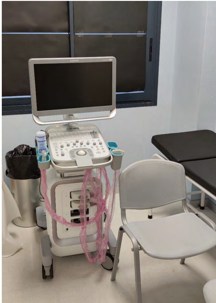
Fotografía 9: Ecógrafo.