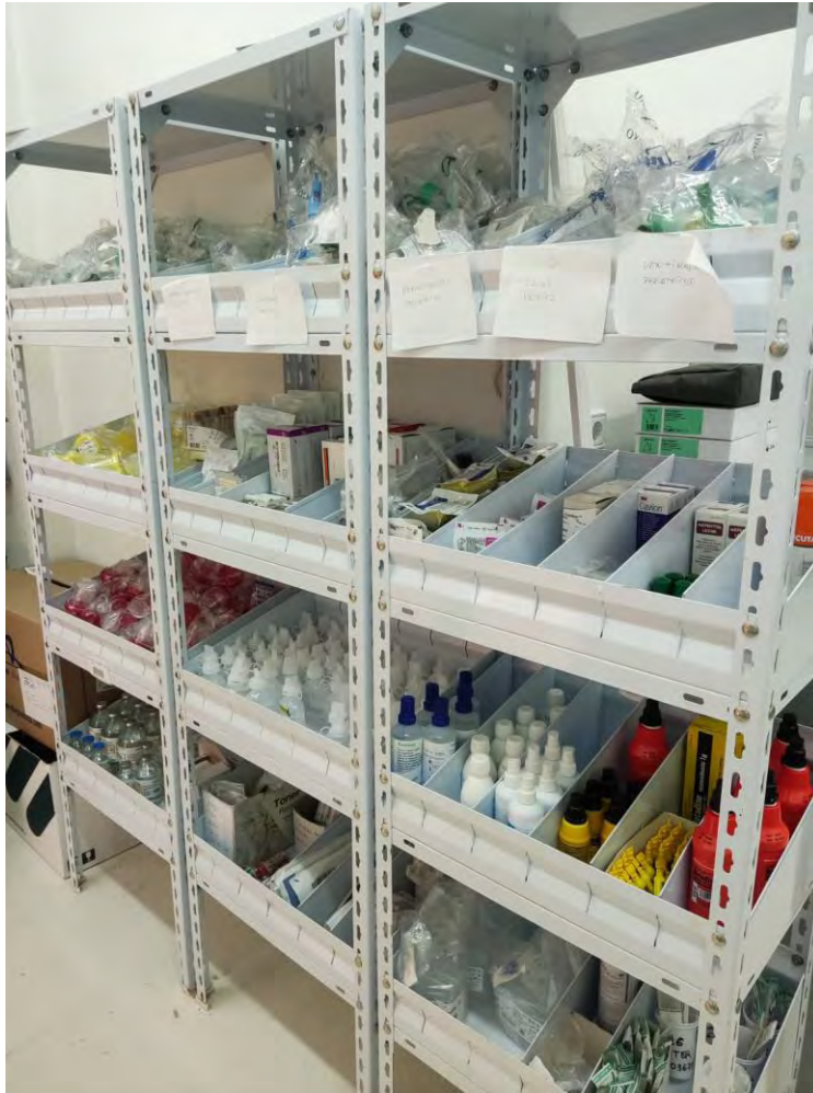
Fotografía 3: Materiales del consultorio.