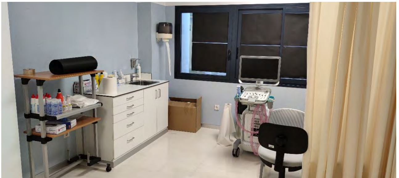
Fotografía 10: Consulta de ecografía.