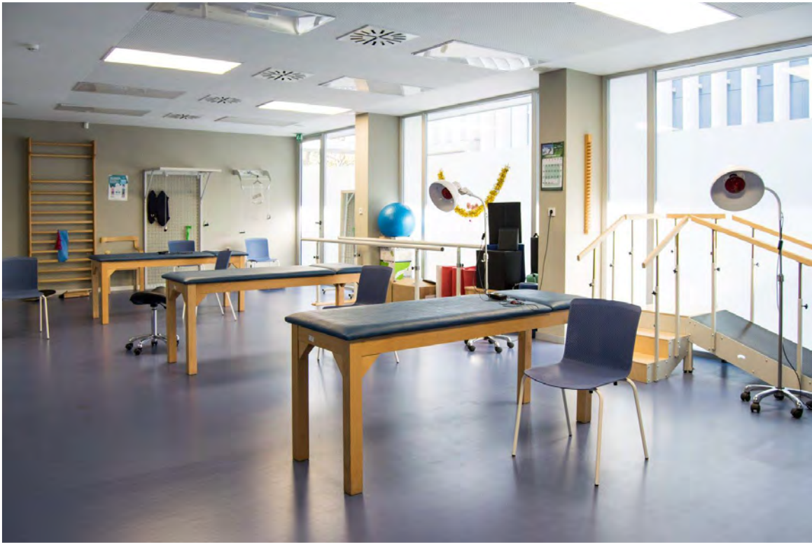
Fotografía 7: Sala de cinesiterapia.