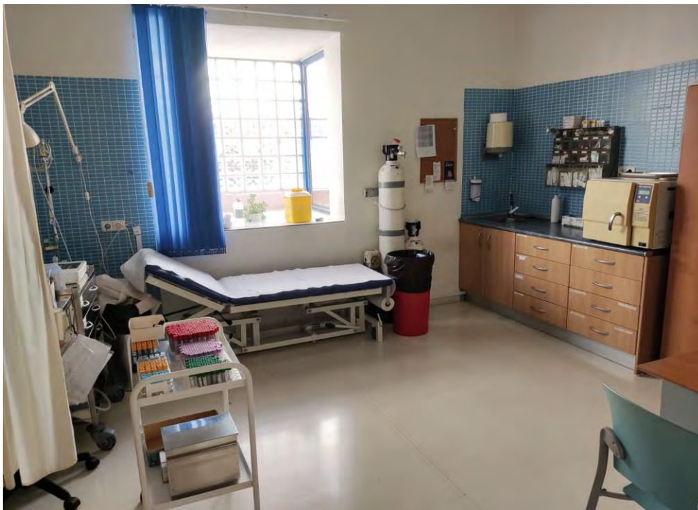
Fotografía 2: Consulta de enfermería.

En nuestra rotación con enfermería hemos aprendido a sacar sangre, hemos hecho electrocardiogramas, controles del INR en pacientes que toman Sintrom, así como visitas a domicilio y curas variadas. Una de las cosas que nos llamó la atención fueron las mediciones de la hemoglobina glicada con un dispositivo especial, ya que no habíamos tenido ocasión de manejarlo antes.