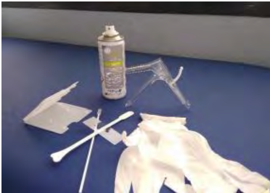
Fotografía 6: Material de trabajo para la toma de citologías.