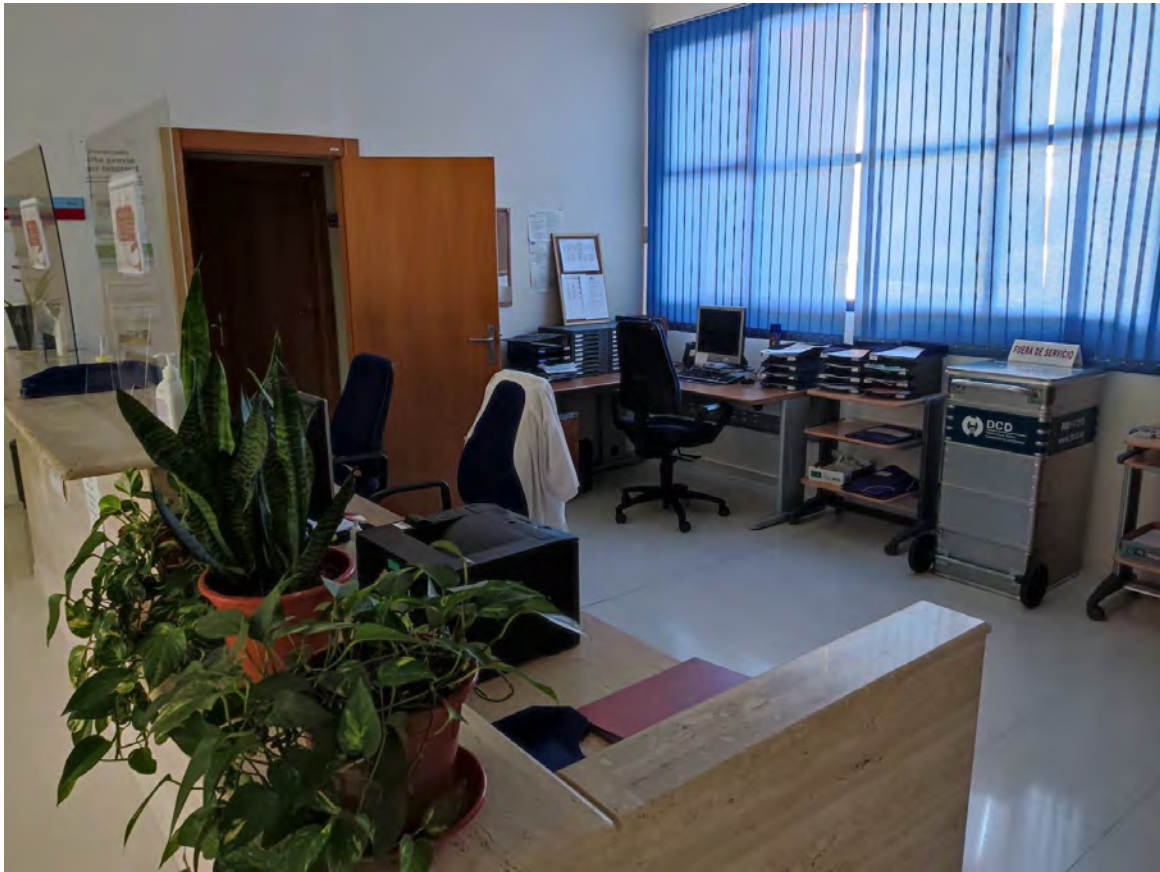
Fotografía 8: Área de administración.