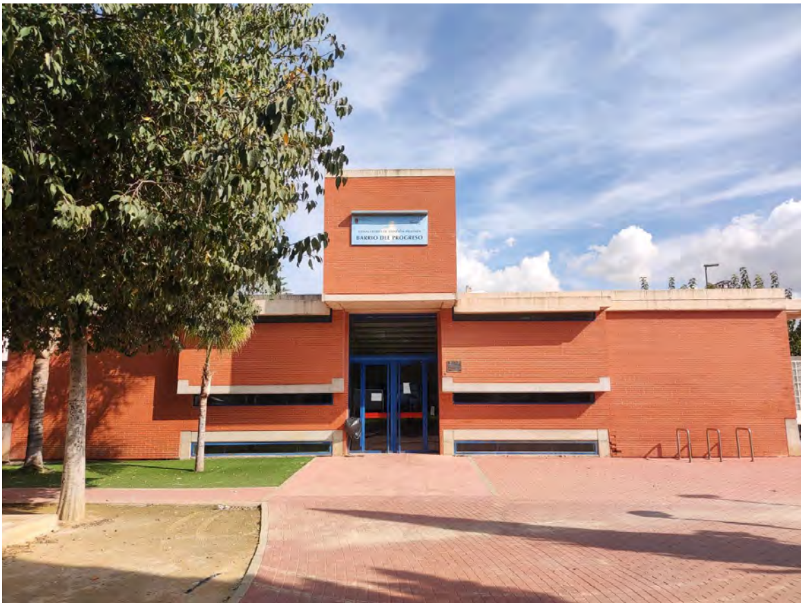
Fotografía 1: Consultorio del Barrio del Progreso.

Con una población adscrita cercana a los 5.600 habitantes, el edificio tiene una superficie de 506 m 2 construidos que se distribuyen en: 3 consultas de Medicina de Familia, 1 de Pediatría y 4 consultas de Enfermería, siendo una de ellas específica de Enfermería Infantil, 9 módulos de salas de espera, zona de Administración, 1 almacén.