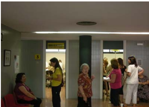
Sala de extracciones y consultas de enfermería a demanda

- Consulta de enfermería a demanda: En esta consulta, en horario de 9 a 14 se atiende la demanda de enfermería, con dos miembros de éste estamento trabajando de 9 a 11,30 y otros dos de 11,30 a 14 horas.